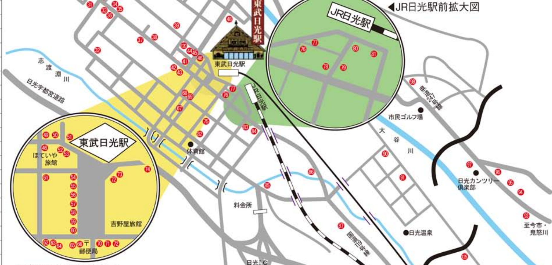
▲東武日光駅前拡大図